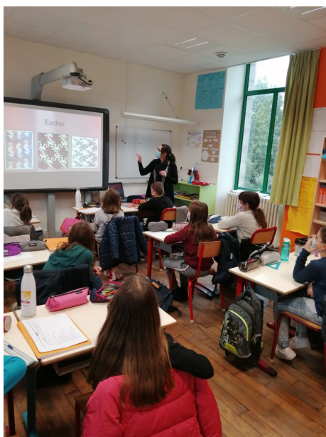
Une professeure de mathématiques de 6ème à l'école pour le défiCM-67ME intitulé "le cube écorné".

Les bulletins scolaires de 6ème sont toujours transmis par les collèges aux enseignantes pour une meilleure transmission et accompagnement dans les parcours individualisés des élèves.