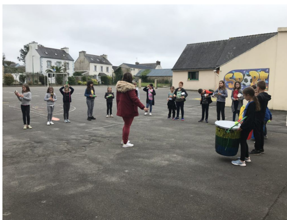
Les CE-CM en pleine démonstration de Batucada pour les plus jeunes.

Il est déjà prévu une sortie cohésion et un séjour plus prolongé pour les primaires à la rentrée 2022 au centre de Kersaliou à Saint-Pol-de-Léon sur le thème de la Bretagne et de la culture maritime.